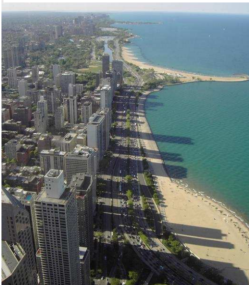
Skyline Chicago vom Hancock Tower