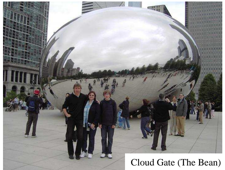
Cloud Gate (The Bean)