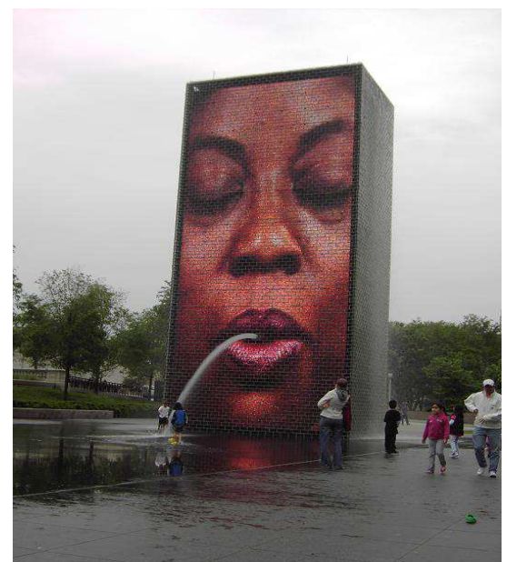
Crown Fountain im Millenium Park